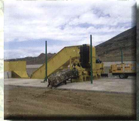
Con alimentador y prensa