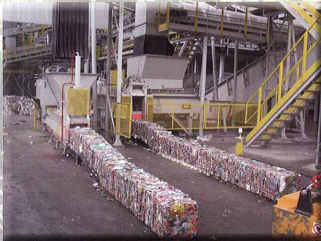
Prensa para metales y chatarras férricos y no férricos FERROUS AND NON-FERROUS METAL SCRAP BALERS