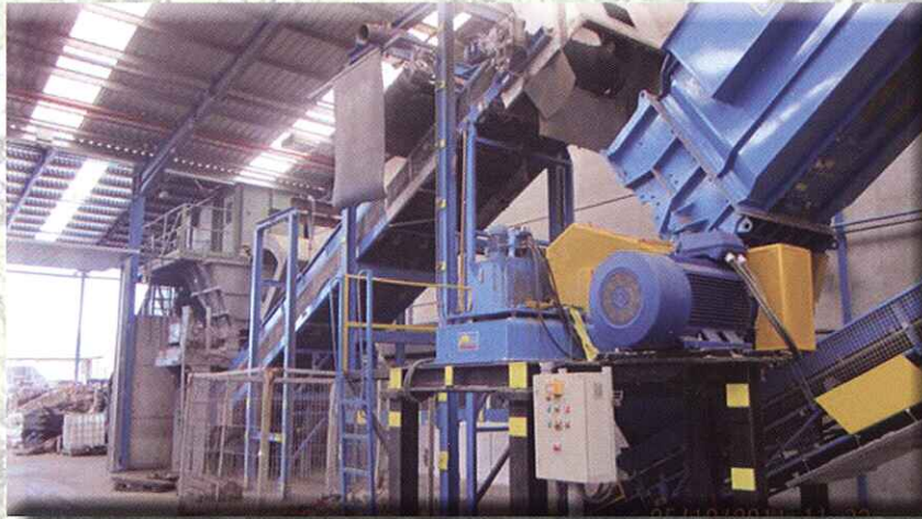
PLANTA COMPLETA "LLAVE EN MANO" TURKEY FULL PLANT