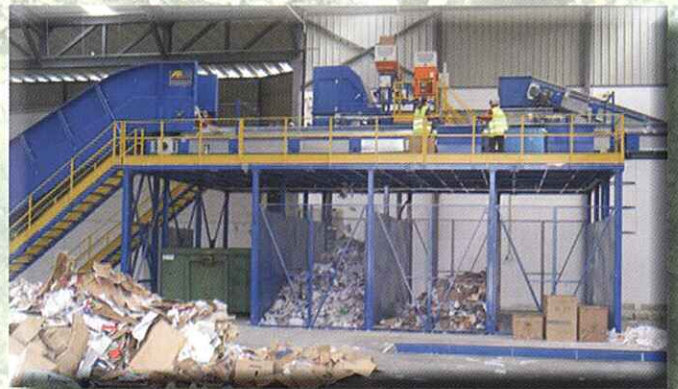
Clasificación de papel y cartón

AUTOMATIC SORTING OF PLASTIC CONTAINERS, CARTONS, ETC.