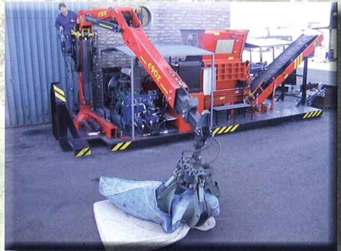
Triturador móvil autónomo multiusos: neumáticos, colchones, bidones, etc.

SHREDDERS WITH HYDRAULIC FLAP FOR PUSHING METAL DRUMS, PLASTIC DRUMS, ETC.