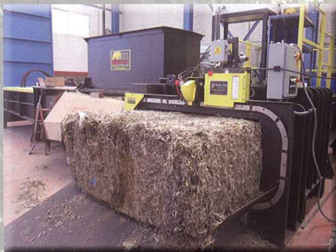
Prensa de doble cajón (o caja cerrada) multiusos con atado de alambre o fleje de plástico TWO RAM BALERS FOR MULTI MATERIALS WITH STEEL WIRE OR PLASTIC STRAPPING AUTO-TIE SYSTEM