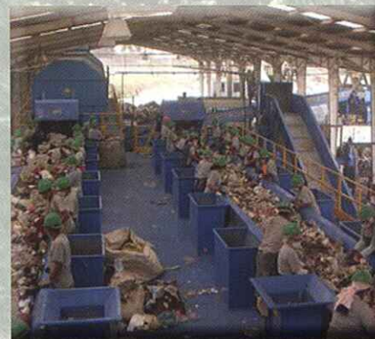
Cinta de clasificación de reciclables

BULKY AND OVERSIZE RESIDUES SORTING CONVEYOR