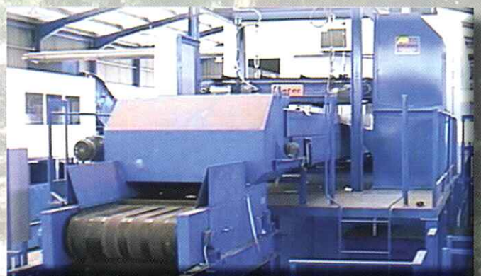
Separador de metales no férricos por corrientes inducidas

NON-FERROUS METAL EDDY CURRENT SEPARATORS