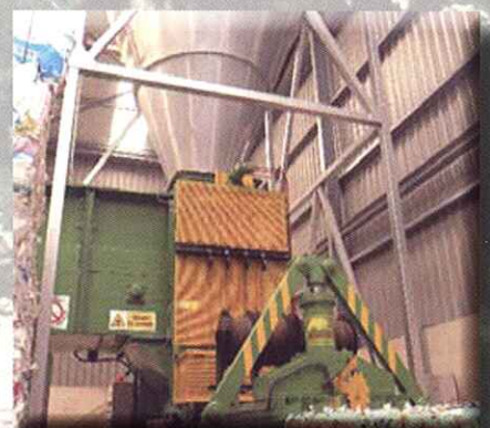
Aspiración de film FILM COLLECTION PNEUMATIC SYSTEM