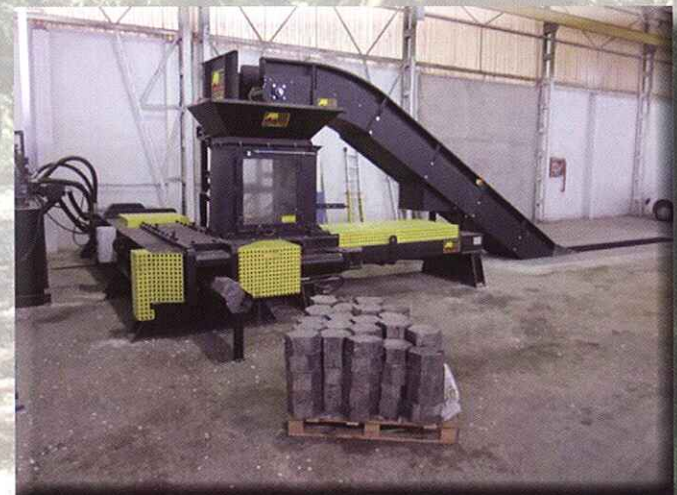
Prensa briquetadora BRIQUETTING PRESSES