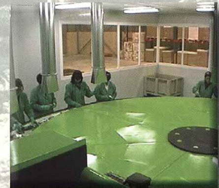
Cinta de clasificación circular