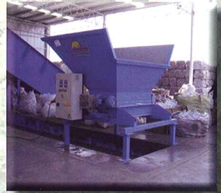
Perforador industrial de alta producción INDUSTRIAL HIGH PRODUCTION PLASTIC BOTTLES PERFORATOR