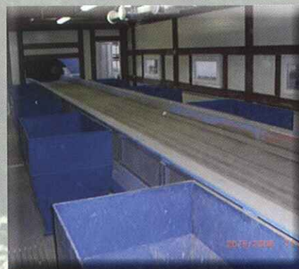
Cinta de clasificación de voluminosos e impropios

BULKY AND OVERSIZE RESIDUES SORTING CONVEYOR