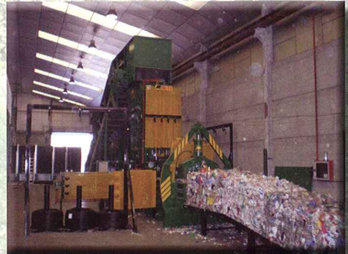
Prensa de doble atado para PET DUAL AUTO-TIE PET BALING PRESS