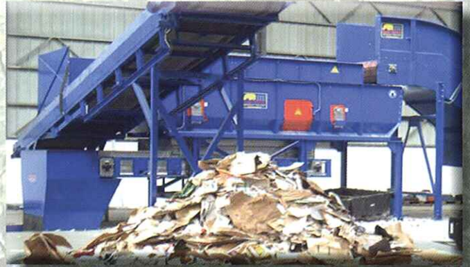
Separación de papel y cartón