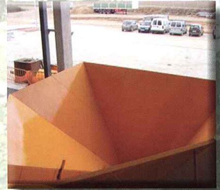
Con tolva para alimentación con pulpo

ON-FLOOR FEEDING CONVEYOR ON TIPPING AREA