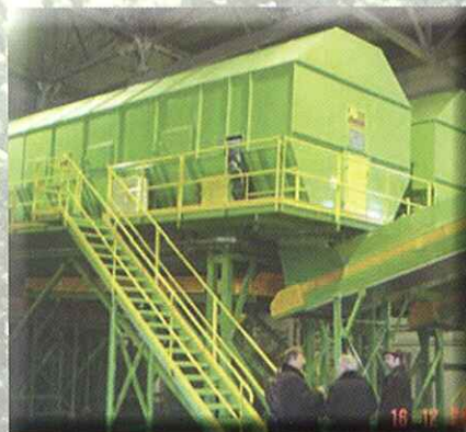
Criba giratoria (tromel) para fracción orgánica

ROTARY SCREEN (TROMMEL) FOR ORGANIC FRACTION