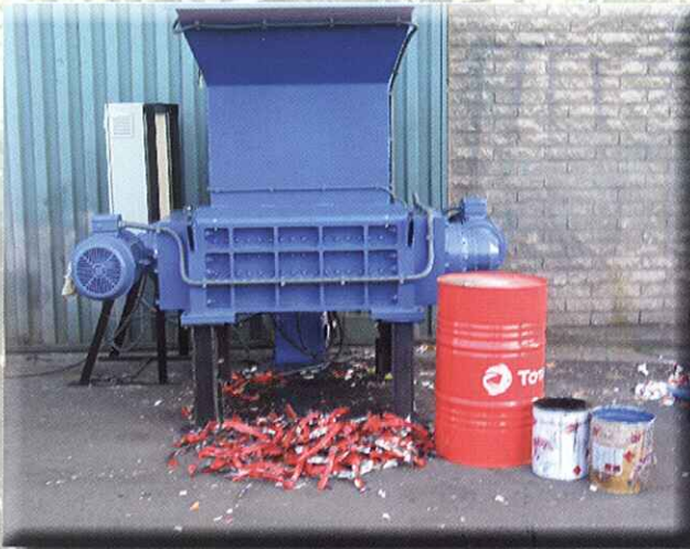
Triturador con empujador para bidones metálicos, garrafas de plástico, etc.

SHREDDERS WITH HYDRAULIC FLAP FOR PUSHING METAL DRUMS, PLASTIC DRUMS, ETC.