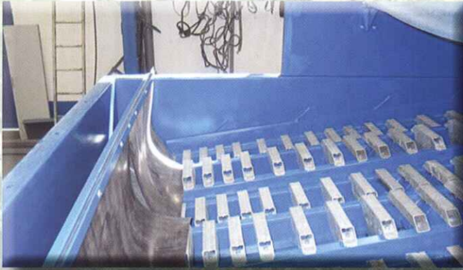
Separación de envases

Automatic sorting with ballistic separators