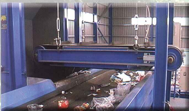
Separador de férricos tipo overband

Automatic sorting with magnetic separators