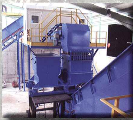
Abridor de bolsas BAG OPENER