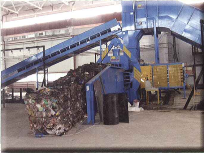
Prensas especiales para RSU / RSI en bruto en fardos de muy alta densidad

MIXED MSW SPECIAL BALERS TO PRODUCE HIGH DENSITY BALES