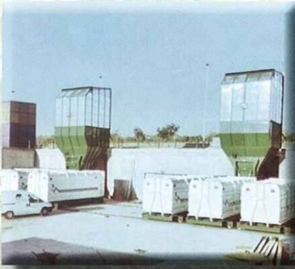
Con tolva de alimentación