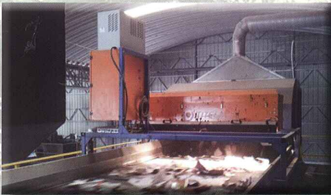
Clasificación de envases plásticos, briks, etc.

AUTOMATIC SORTING OF PLASTIC CONTAINERS, CARTONS, ETC.