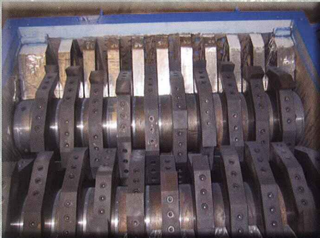
Sistema de cuchillas individuales desmontables

MULTI MATERIAL AUTONOMOUS MOBILE SHREDDER: USED TYRES, MATTRESSES, DRUMS, ETC..