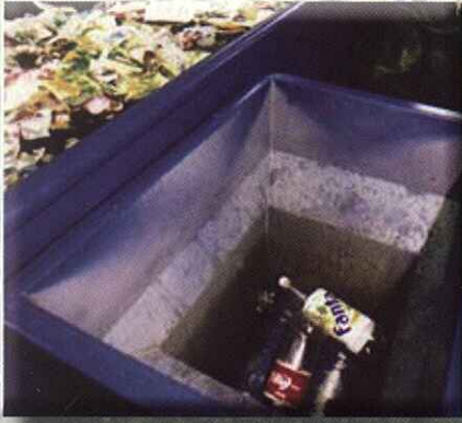
Perforador en tolva de selección PET PERFORATOR IN SORTING CHUTE