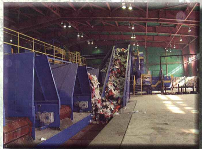
Cintas silos de almacenamiento BUNKER CONVEYORS