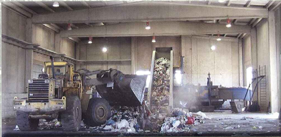
Plantas de prensado y enfardado de RSU en bruto