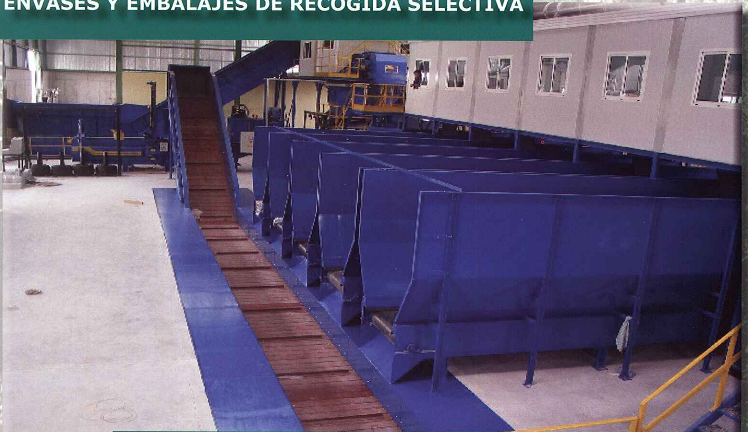
CONTAINERS AND PACKAGING FROM PRE SORTED COLLECTION