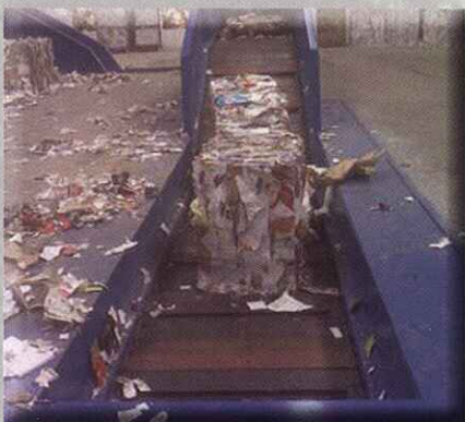
Abridor de fardos BALE BREAKER