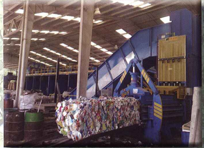
Prensa multiproducto para papel, cartón y envases (briks y plásticos) MULTI MATERIAL BALER FOR PAPER, CARDBOARD, PLASTICS, CARTONS (TETRA BRICKS)