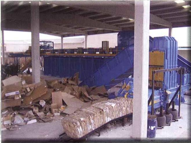
Prensa para papel y cartón PAPER AND CARDBOARD BALERS