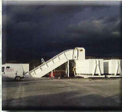
Con alimentador metálico