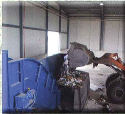
Alimentador sobre solera en playa de descarga

IN-FLOOR FEEDING CONVEYOR ON TIPPING AREA