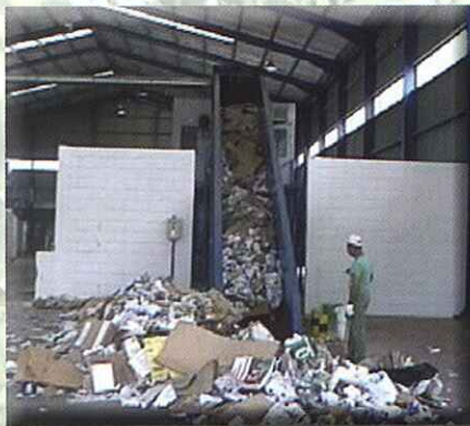
Alimentador en foso en playa de descarga

IN-FLOOR FEEDING CONVEYOR ON TIPPING AREA