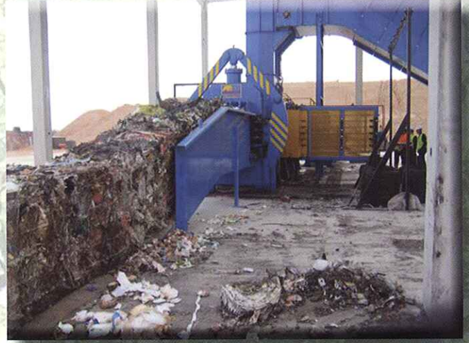
Prensas para rechazo de RSU / RSI

MIXED MSW SPECIAL BALERS TO PRODUCE HIGH DENSITY BALES