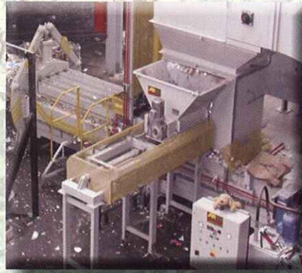
Perforador desplazable en tolva de prensa RETRACTABLE PET PERFORATOR IN BALER HOPPER