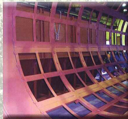
Criba giratoria (tromel) para residuos voluminosos

ROTARY SCREEN (TROMMEL) FOR ORGANIC FRACTION