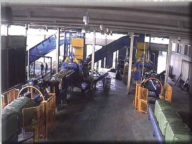
Plastificado opcional de fardos de RSU / Rechazo

OPTIONAL WASTE BALE PLASTIC WRAPPING SYSTEM