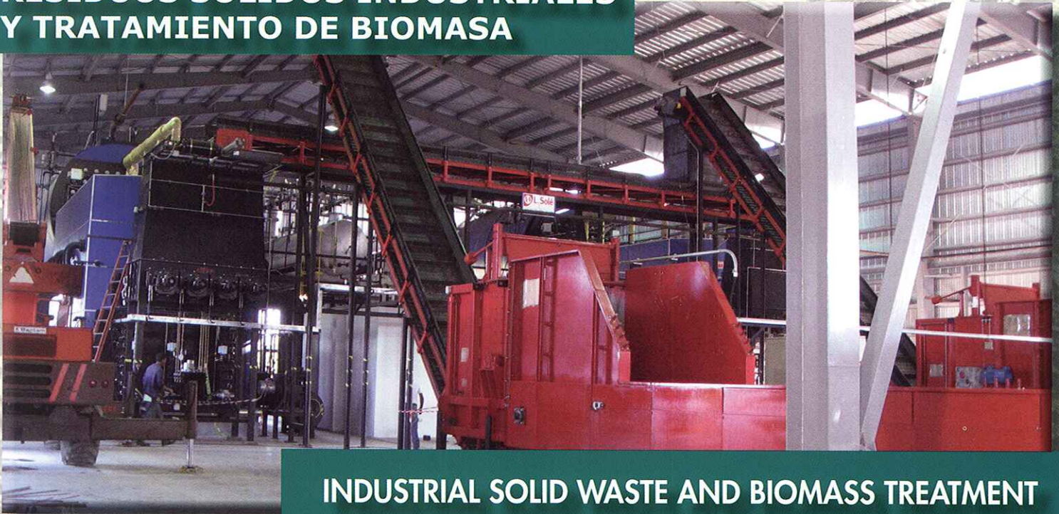
INDUSTRIAL SOLID WASTE AND BIOMASS TREATMENT